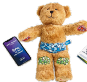
Rufus der Bär

https://www.rosenfluh.ch/qr/minecraft-for-type-1-diabetes