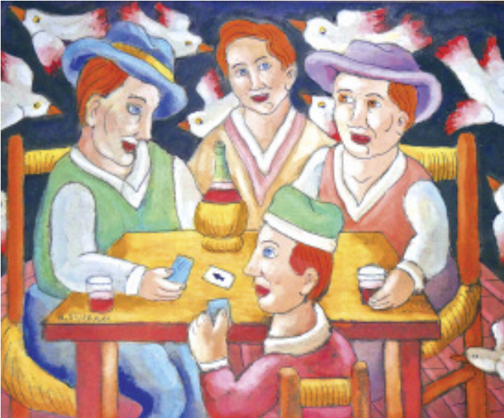
La partita a carte Roberto Sguanci, Ölbild auf Karton Nähreres zum Bild auf Seite 70.