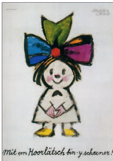
Herbert Leupin – Plakat, 1958